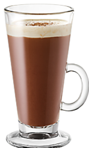
Le chocolat chaud maison avec mousse de lait