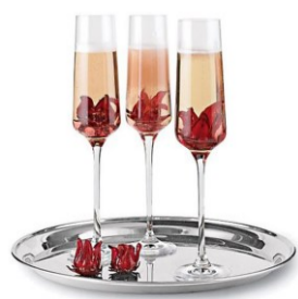
Le kir hibiscus (fleur comestible)