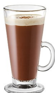
Le chocolat chaud maison avec mousse de lait