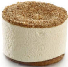
Le soufflé glacé au caramel ou Grand Marnier