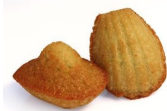
La madeleine Jeannette